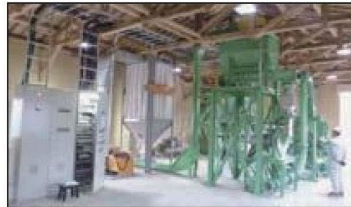
木粉製造設備（粉砕機）