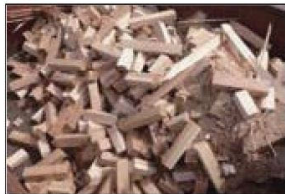
製材所から発生するスギ端材